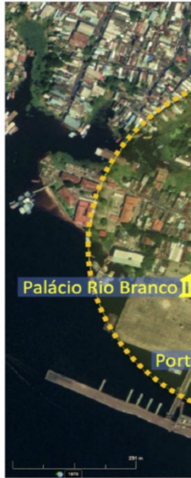
Polo Digital Manaus