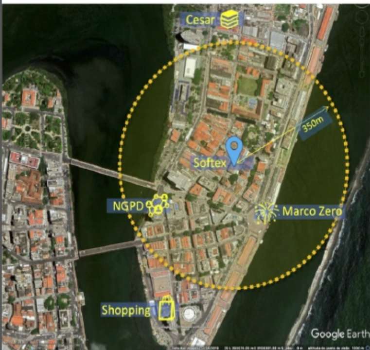
Porto Digital, Recife