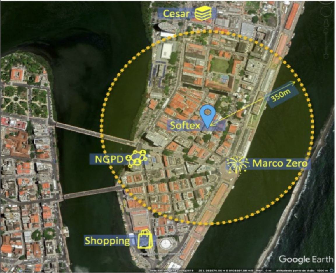
Porto Digital Recife