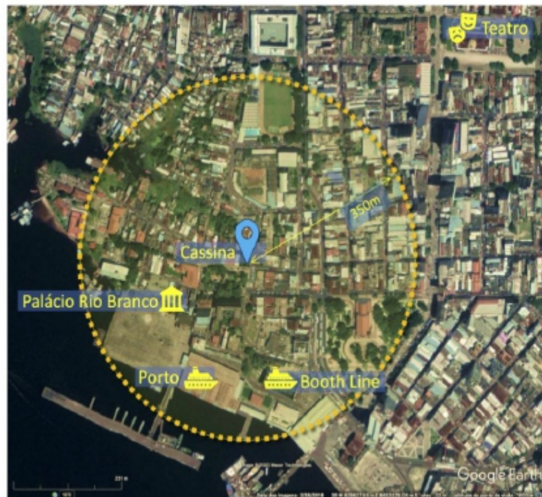
Polo Digital, Manaus – entorno do Hotel Cassina