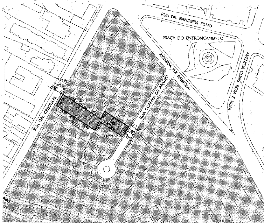
Figura 01- Localização do terreno do empreendimento.

imóvel de nº 113 da Rua das Creoulas com o imóvel nº 80 da Rua Correia de Araújo, conforme figura abaixo.